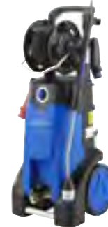
MC 4M XT*